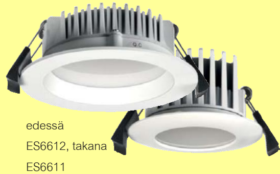
edessä ES6612, takana ES6611